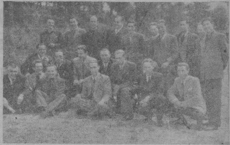
Secretarios rurales de las Hermandades del Campo que hacen un cursillo en la Escuela "Santiago Apóstol"