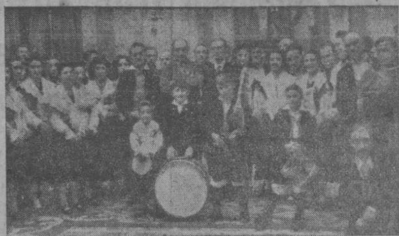
Los coristas gallegos llegados a Madrid para intervenir en varios conciertos en nuestra capital, son recibidos por el Alcalde en el Ayuntamiento.