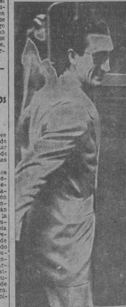
MADRID.—El famoso diestro cordobés Manolete desciende del tren a su llegada a Madrid, de regreso de su triunfal campaña en América. (Foto CIFRA).