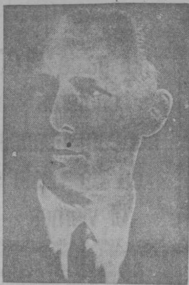
JORGE II DE GRECIA

(World copyright by United Features Syndicate. Derechos exclusivos para su publicación en España, adquiridos por la Agencia EFE. Prohibida la reproducción.)