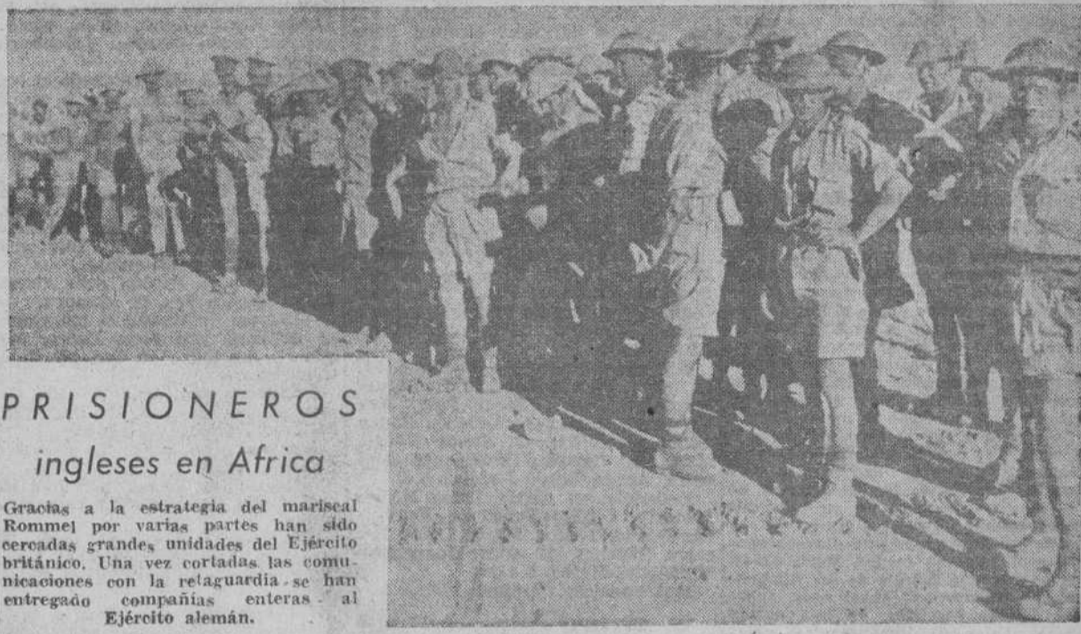
PRISIONEROS ingleses en Africa

Era la expedición más fuertemente protegida que enviaban los anglosajones a la U. R. S. S.