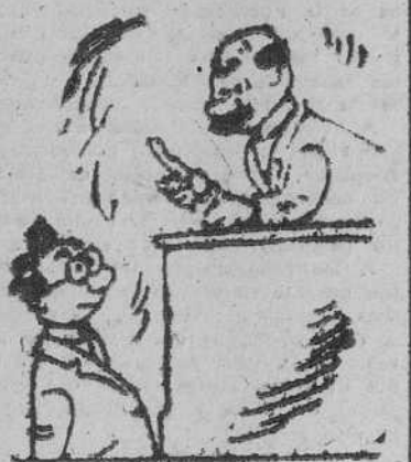
OPOSITOR, por GALINDO —¡Le pregunto de qué nación es Sebastopol y no quiere Vd. contestarme? ¿Es que quiere Vd. perder la plaza también?