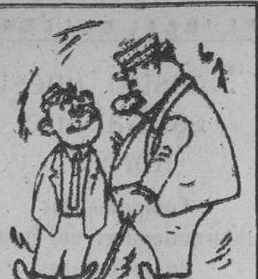
EN AFRICA, por GALINDO —¡Gran triunfo germano-italiano en el desierto! —Sí. Cada uno ha puesto su granito de arena.

BEJAR, 25.—Después de la ofrenda ante la Cruz de los Caídos, hecha por el ministro de Trabajo, éste se dirigió de nuevo a la tribuna instalada en el