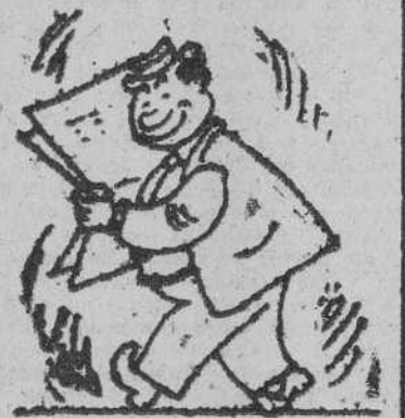
LO DE EGIPTO, por GALINDO —¡Piramidal!