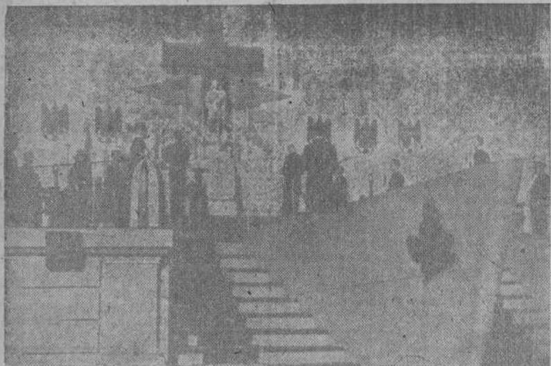
SAN FERNANDO (CADIZ).—Entrega de despachos en la Escuela Naval Militar a los nuevos tenientes de Infantería de Marina. La Misa.