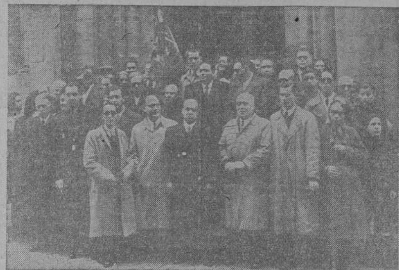
Grupo de autoridades y ciegos que concurrieron a la función religiosa celebrada en la capilla de San Andrés con motivo de la festividad de Sta. Lucía