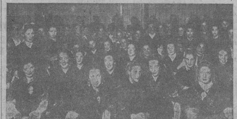
Santiago. Fiesta gallega en honor de las camaradas que asisten al Consejo Nacional de la Sección Femenina. (Foto ARTURO).

BERLÍN 23.—El ministro secretario general del Partido, camarada Arrese, y la delegación española,