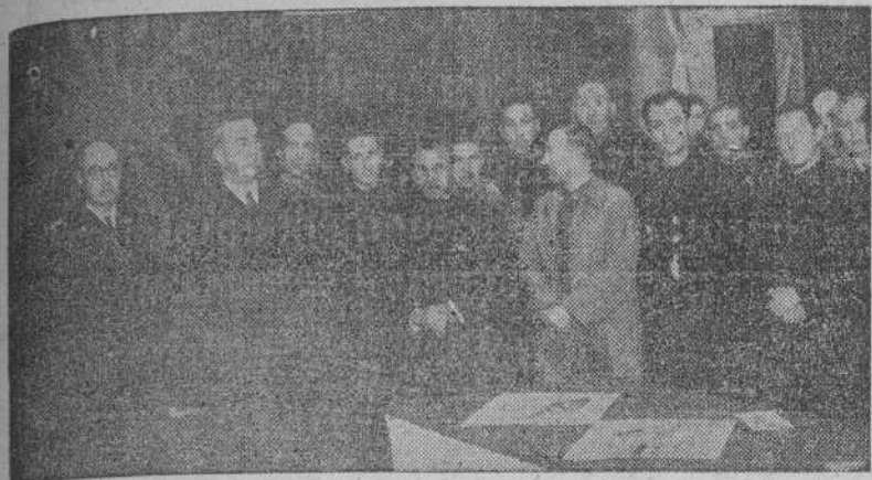
Autoridades y jerarquías en el acto inaugural de la exposición de trabajos de aprendices encuadrados en el Frente de Juventudes.

Presidieron las autoridades, jerarquías y representaciones oficiales