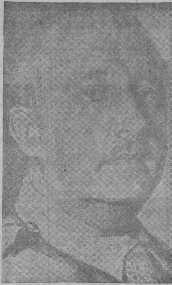
ruina y la muerte. (Una clamorosa ovación es tributada al Caudillo).

España a partir de aquel momento histórico en que Colón con sus carabelas descubrió un nuevo mundo, no hizo más que desangrarse en servicio universal de la Humanidad; nuestras inquietudes volaban dentro de nuestros navíos hacia América, y nuestros mejores hombres, los que no se conformaban con un pequeño espacio, iban a América buscando un porvenir y un poderío. Y aquellos bravos que para alumbrar un mundo morían a millares, unas veces de hambre, otras de fatiga o de las flechas de nuestros enemigos, aquellos héroes llevaban y hacían valer las inquietudes de España, pero al mismo tiempo le prestaban ese fajo de inquietudes, esas flechas en haz para poder hacer la España grande heroica y libre. Repito que las discordias de los siglos últimos, esas inquietudes, enfrentaban a hermanos con hermanos, no eran más que un sistema de vitalidad. Nosotros las censuramos en cuanto tiene de perjuicio por la Patria, de materialismo grosero y de falsedad, pero nosotros no las censuramos por sus aspiraciones, porque estamos conformes en que sus inquietudes eran las de la Patria, eran las de la nación española que tenía alas para volar y no toleraba la mediocridad porque encontraba en España pequeña para sus propios hijos: iban contra aquello en que no estaba la verdad, sino la falsedad, la