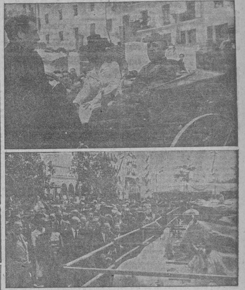
S. E. el Jefe del Estado, Generalísimo Franco, acompañado de su esposa y del alcalde de Sevilla, pasea en coche por el ferrial