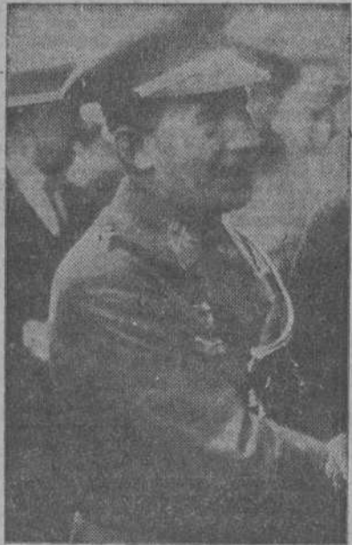
El teniente general Barrera

En la casa mortuoria se han recibido numerosos telegramas de provincias, en-