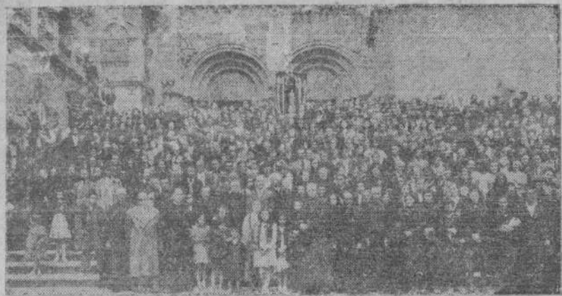
Peregrinación del Arciprestazgo de Nemanco que comprende las parroquias de Vimianzo, Finisterre, Cúa y Mugla

Mañana, a las ocho y media, habrá una misa de comunión para inaugurar una capilla, instalada en el local del Consejo Diocesano de las Jóvenes de Acción Católica. La bendición de la capilla fué efectuada por el párroco don Bernardo Louró, que ostentaba la representación del señor Arzobispo.