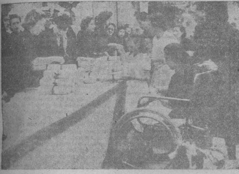
SEVILLA.—La esposa del Caudillo, doña Carmen Polo de Franco, distribuyó en el Alcázar, ayudada por la señora de Arrese y la Falange femenina, 10.000 bolsas con comestibles y telas a otras tantas familias necesitadas.

La Medalla de Oro de Sevilla, impuesta al Jefe del Estado que ha sido aclamado con entusiasmo inenarrable