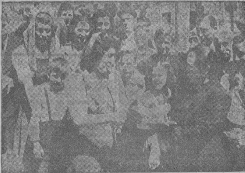
Camaradas de la Hermandad de la Ciudad y el Campo repartieron aves, conejos y semillas entre las campesinas

Camaradas de la Hermandad de la Ciudad y el Campo repartieron aves y semillas entre los campesinos