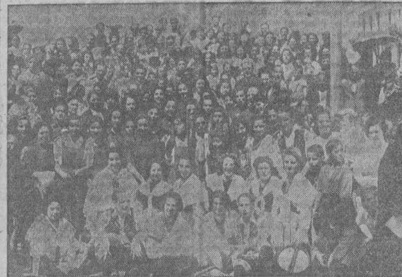
Concurrentes a la tradicional fiesta de San Isidro celebrada en la parroquia de San Pedro de Mezonzo

gran elocuencia habló de la modestia, humildad y caridad de San Isidro, de sus milagros y del ejemplo de su vida austera de trabajador santo. Luego