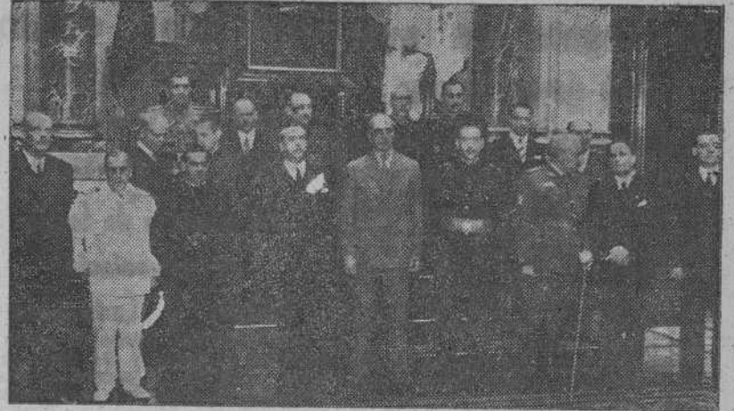
El señor Embajador de la Argentina, con las autoridades y jerarquías, durante su visita al Palacio Municipal.

(CONTINUACION DE PRIMERA) guera, Folla Fernández y Morales de Setien.