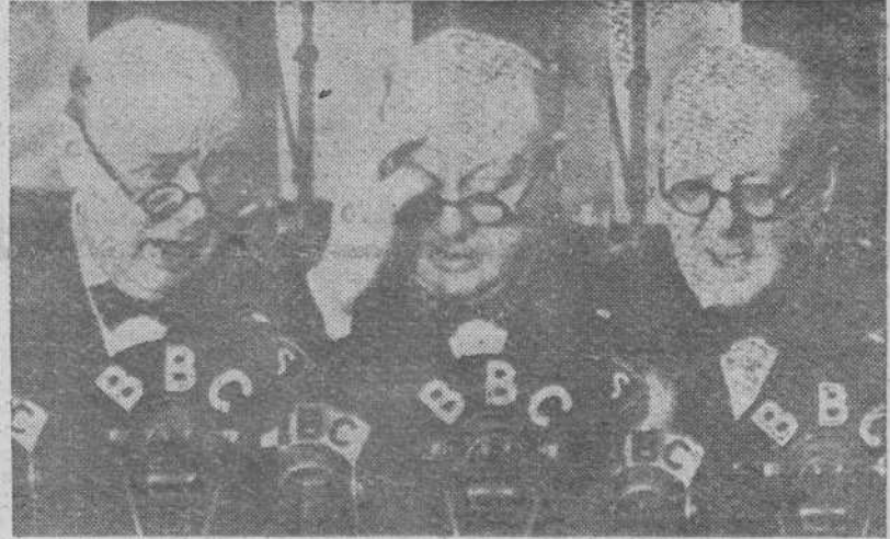
Winston Churchill, Primer Ministro británico, en tres momentos durante un discurso difundido por la radio

WAYLAND (Nueva York) 31.—25 personas han resultado muertas y 150 heridas en un accidente ferroviario, al chocar un tren de mercancías con otro de pasajeros.—(EFE).