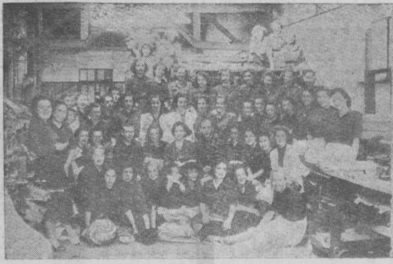
Maestras del S. E. M. durante la visita que en la tarde de ayer hicieron a los talleres de EL IDEAL GALLEGO

Dichos trabajos han de ser enviados a esta Delegación Nacional de Prensa, sección de asuntos generales, consignando el nombre y domicilio del autor, requiriéndose para su admisión que sean inéditos. El tema del concurso para el mes de agosto versará sobre "Los navegantes de España en la empresa del Nuevo Mundo".