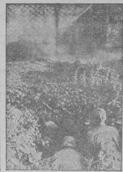
En el frente del Este.—Los tanques alemanes, han penetrado ya en el pueblo tomado como objetivo y los soldados de infantería aguardan solamente la orden que les haga avanzar.