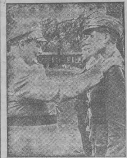
El Mariscal del Reich, Goering, en Hamburgo, conversando con un grupo de jóvenes ayudantes de la defensa antiaérea