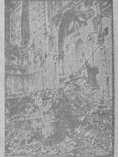
Un aspecto del templo gótico de Santa Clara, panteón de los reyes napolitanos de la Casa de Anjou, después de los últimos bombardeos aéreos.