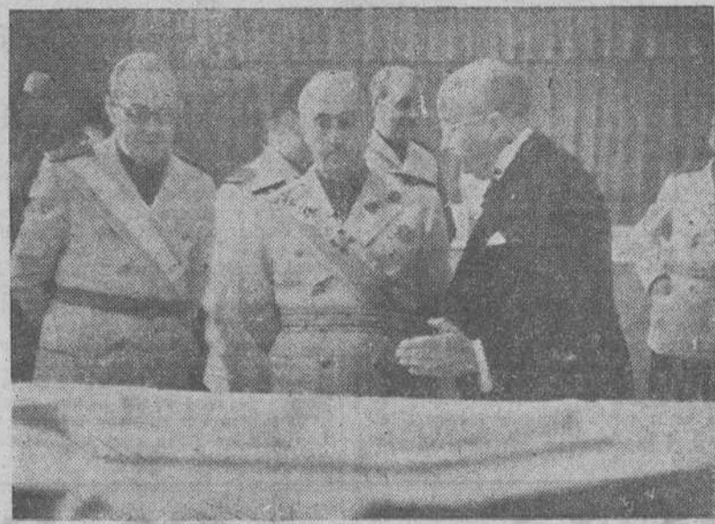
El generalísimo Franco examina las maquetas en el pabellón de oficinas de la Ciudad Universitaria.

CUARTEL GENERAL ALIADO EN EL PACIFICO SUDOESTE, 14.—El comandante jefe de las fuerzas navales del Pacífico, almirante Alsey, ha declarado hoy, jueves, que los aliados son dueños absolutos de las islas de Kolombangara y Vella Lavella (Archipiélago Salomón).—(EFE).