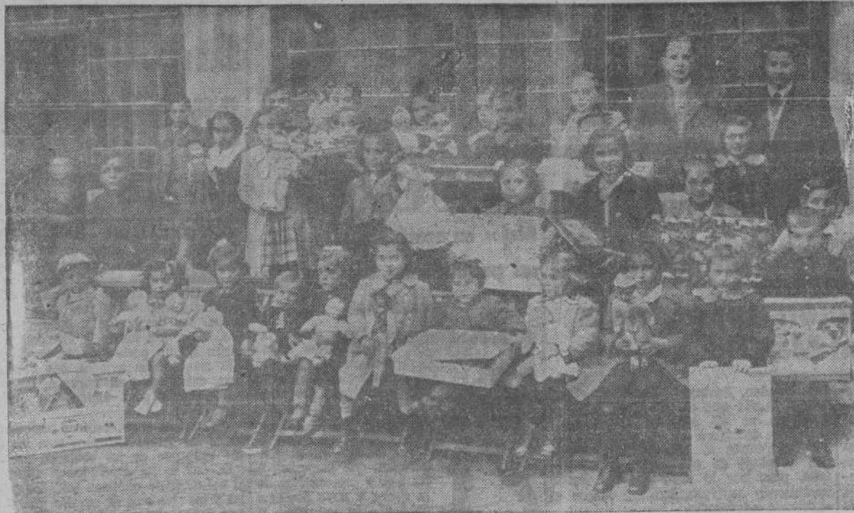
Los hijos de los periodistas coruñeses que fueron espléndidamente obsequiados por los Reyes Magos de la Asociación de la Prensa en una fiesta organizada con el encendido amor por las cosas del espíritu, peculiar en la Hermandad constituida por los profesionales del periodismo

Y he aquí otra razón importantísima del viraje, a que se ha visto obligado