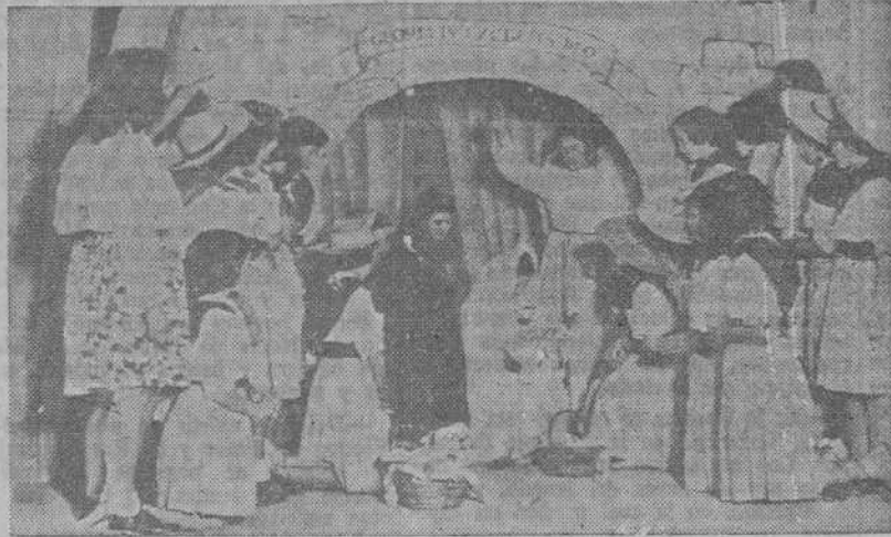
Arriba: Coro de las Flechas de la Sección Femenina de La Coruña, que obtuvo el primer premio en el concurso de villancicos celebrado en nuestra ciudad, y que ayer tarde actuó en las funciones teatrales celebradas por el Frente de Juventudes con motivo de la fiesta de Reyes. Abajo: La Adoración del Niño Jesús, cuadro representado por las pequeñas camaradas de la S. F.