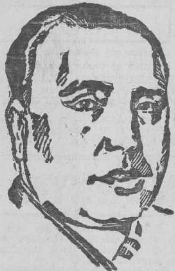
D. Eduardo Aunós, Ministro de Justicia