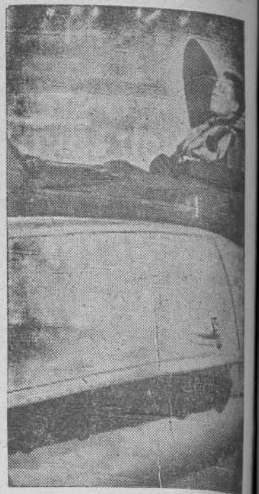
Aviadores de caza alemanes preparados para partir, esperan la orden tomada el sol de Primavera

auxiliar de la diócesis ha recibido un telegrama del Primado de España, Sr. Piá y Deniel, que dice: "Rogando al Señor restablecimiento del Arzobispo, agradeceré noticia".