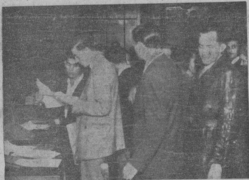
Es realmente extraordinaria la afluencia de productores que diariamente desfilan por la Delegación Provincial de Sindicatos de La Coruña. Nuestro fotógrafo ha captado un aspecto parcial de la animación que reina en dicho Centro.

Como se ve, todo está previsto, para que no quede nadie sin emitir su voto.