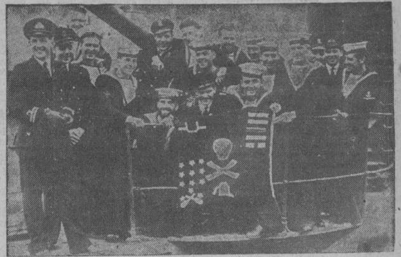
La tripulación del submarino británico "Ultimatum" sonríe satisfecha con su bandera de combate, al regresar a un puerto británico después de un largo crucero.