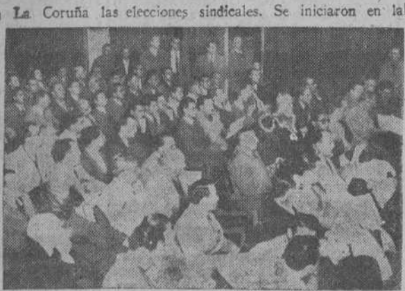
Un aspecto del salón de actos de la Casa de la Falange, durante la reunión de los componentes designados para constituir las mesas electorales en La Coruña

PARIS, 20.—Pierre Laval ha sido condenado a muerte en rebeldía por el tribunal de Marsella, que lo ha encontrado culpable de "conspiración con el enemigo contra la seguridad del Estado", según anuncia Radio París. Ha sido igualmente condenado a muerte por el mismo delito, el antiguo editor del periódico "Le Petit Marseillais", Jean Gaillard Bourra-