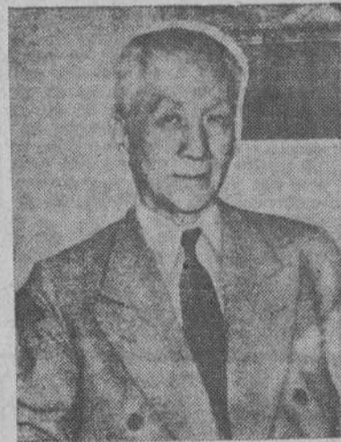
Don Sergio Osmeña, actual Presidente de Filipinas

"Como consecuencia de una operación anfibia de gran envergadura, nos hemos apoderado de la costa oriental de la isla de Leyte, en Filipinas, situada a 600 millas al Norte de Morotai y a 2.500 de la bahía de Milne, donde comenzó nuestra ofensiva hace casi dieciséis meses. El punto de penetración en Visayas que hemos elegido se halla a mitad de camino entre Luzón y Mindanao, de modo que de un solo golpe hemos cortado en dos a las fuerzas japonesas en Filipinas. El hecho de que el enemigo esperaba nuestro ataque en Mindanao, nos permitió sorprenderle en Leyte, donde hemos conseguido establecer cabezas de puente en el sector de Tacloban, con bajas muy reducidas. El desembarco fue precedido por un bombardeo naval y aéreo, que tuvo resultados eficacísimos. Nuestras tropas ensanchan sus posiciones rápidamente, y ya han empezado a llegar suministros y material pesado en gran volumen. Las fuerzas están integradas por uni-