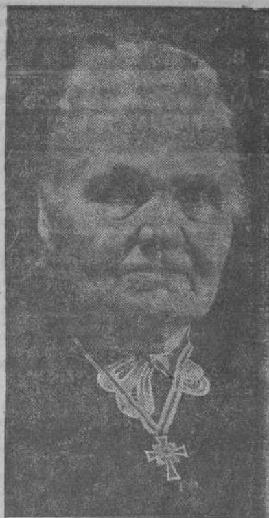
Una mujer alemana que ha perdido ocho hijos, siete de ellos en los frentes de batalla, acaba de ser condecorada con la "Cruz de la Madre"