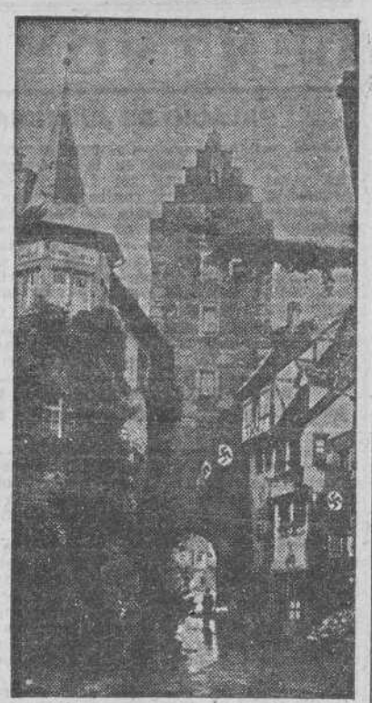
La bella ciudad Merseburgo, en el Lago Bodensee se ha convertido en ciudad hospital para los heridos de guerra del Reich. He aquí un típico rincón de Merseburgo

MADRID 4. —A las doce y media de la mañana del día de hoy y en el salón Goya del ministerio de Educación Nacional, el titular del Departamento don José Ibáñez Martín, ha recibido a una importante representación de la Inspección de Primera Enseñanza española.