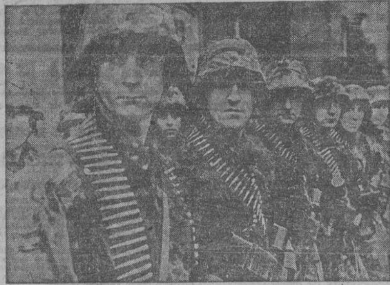
Una compañía de granaderos alemanes recibe, formada, las órdenes dadas por el Alto Mando. Minutos después entrará en fuego.