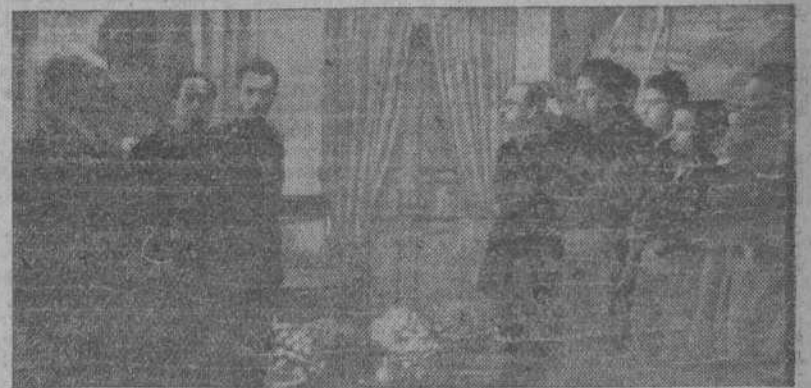
MADRID.—El Caudillo dirige la palabra a los cadetes del Campamento de Rurals encuadrados en el Frente de Juventudes, que le ofrendaron frutos en el Palacio de El Pardo con motivo de la festividad de S. Isidro Labrador.