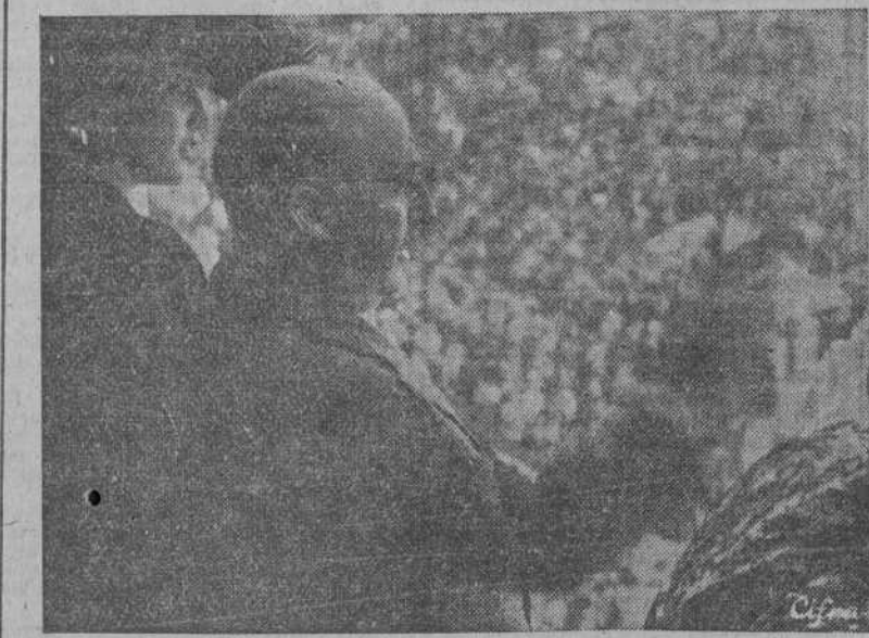
S. E. el jefe del Estado saluda a la muchedumbre que lo aclamó a su llegada para presidir la corrida de la Beneficencia, celebrada en la Plaza madrileña. (Foto CIFRA).

lejos sus reclamaciones con un deseo de represalia".—(EFE).