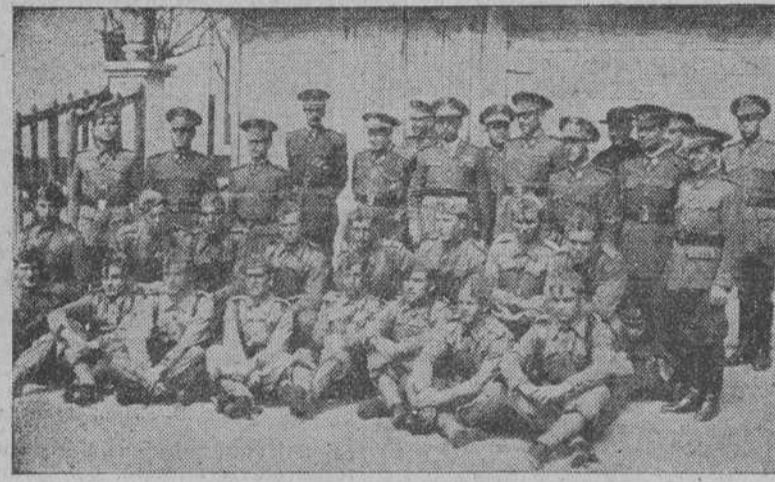
Grupo de soldados pertenecientes al Batallón de Transmisiones que has sido premiados por su comportamiento y aplicación durante el año. El general Durán Salgado hizo entrega de las recompensas.