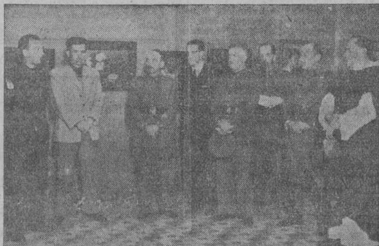
Autoridades y jerarquías en el acto de inaugurar la V Exposición de Arte del S. E. U., instalada en la Asociación de Artistas

Todas las personalidades deteniéndose con el mayor detenimiento las instalaciones, haciendo grandes elogios de la perfección de esa muestra de la capacidad de los aprendices de las industrias de La Coruña, Santiago y Ferrol que presentan sus tra-