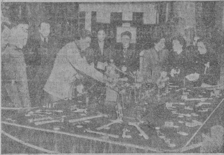
Un aspecto de la Exposición de Trabajos de Aprendices, en la planta baja del Palacio Municipal

Están instaladas en la Asociación de Artistas y en la planta baja del Ayuntamiento