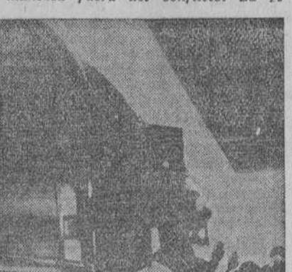
"La reunión con Hitler es cordial por ambas partes, pero más bien un monólogo que otra cosa..."

28 de abril.—"Otra carta de Hitler al Duce... Son, en general, de poca importancia, pero Hitler es un buen psicólogo y sabe cómo llegar profundamente al alma de Mussolini..."