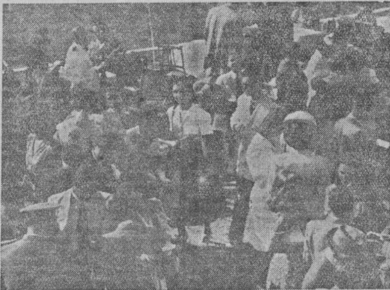
Aspecto parcial de la distinguida concurrencia al espectáculo hípico que se celebra en Riazor

Se ha fundado en la barriada del Montijo un club que lleva el nombre de "Cultural Montijo", el cual, nada más empezar, reta al Imperial de San Pedro de Nos para jugar el domingo día 5, en el campo de éste último, a cualquier hora de la tarde.