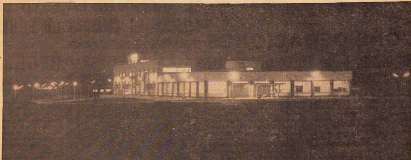
En la tranquila noche pontevedresa, las luces de TAFISA, ponen su nota de alegría y trabajo, iluminando como un símbolo, las nuevas rutas que nuestra capital ha emprendido, en pos de un progreso y una renovación que alcanza a todos los órdenes de la vida.

EXTRAORDINARIA FOTOGRAFIA NOCTURNA DE LA MAS IMPORTANTE INDUSTRIA PONTEVEDRESA