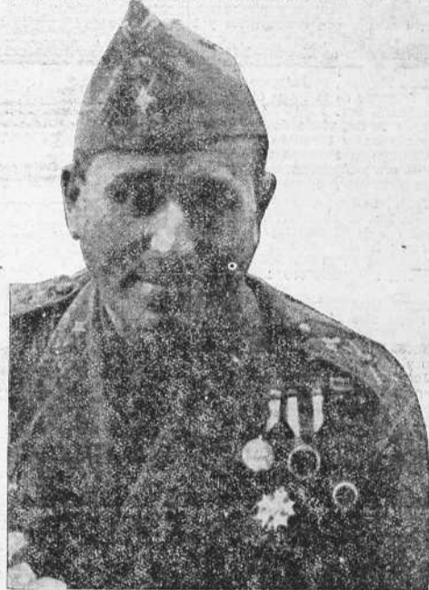
Don José Millán Astray

El general Millán Astray, el glorioso mutilado, creador de la Legión que tantas páginas de honor genuinamente española lleva escritas y que en los presentes momentos de resurrección de la España eterna está escribiendo la mejor de todas, llega hoy a La Coruña, Caballero de España, pregonero por los mares del mundo de las virtudes esenciales de la raza española, el sacudimiento vigoroso de la Patria contra todos los internacionalismos que trataban de descomponerla y de arruinarla le encontró por tierras de América. Su deber le llamó allí donde está España. Y el glorioso mutilado, que tantas veces escribió, con los rubies de su sangre, la lección magnífica de cómo se muere por la Patria, ha emprendido por los campos de España la predicación de la Reconquista.