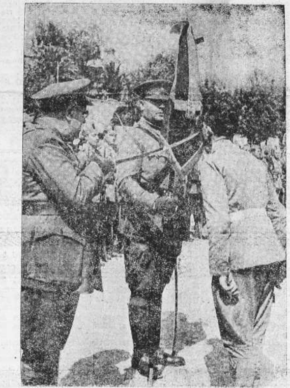
Un soldado de los recientemente incorporados besa la cruz de la bandera y el sábio durante la ceremonia del juramento de fidelidad a la Patria celebrado en la mañana de ayer en los Cuorpos de Artillería, Intendencia y Sanidad de nuestra capital.

por una bala, en un muslo, resultando herido de alguna gravedad.