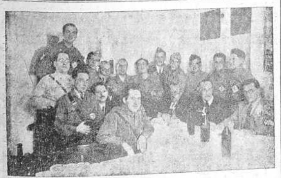
Comida íntima con que fueron obsequiados varios elementos de la Embajada japonesa recientemente llegados del frente.