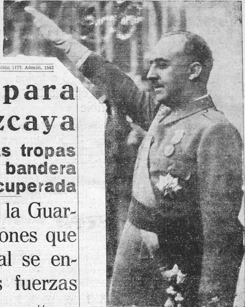
¡Franco! ¡Franco! ¡Franco! Era un grito imponente que salía de miles de gargantas españolas. España entera, en pie, junto a su Caudillo. Gritos recios, viriles como de quienes están seguros de su victoria y de la grandeza de su causa. Para que el mundo se entere de nuestra voluntad indomable de terminar la obra gloriosa. Para que nadie dude de que solamente Franco, el artífice de la victoria, es el jefe legítimo y admirado de todos los españoles.

No podía ser de otro modo. En las lejanas tierras fecundadas con sangre española no pueden permanecer indiferentes ante la gran cruzada de la Madre Patria.