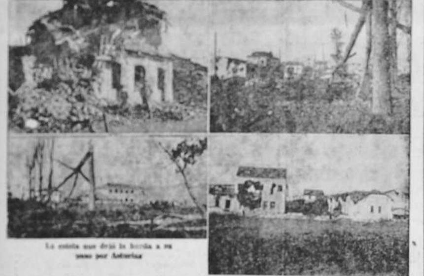
La comida que sirve la banda a su jefe por Asturias

En la ciudad de Oviedo, por el sistema de Belarmino, se han establecido comedores benéficos, cooperativas de trabajo, un ejército del pueblo, y un sistema de graduación en el mismo ejército.