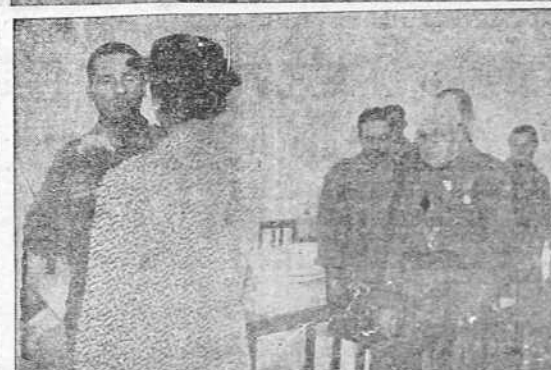
Varios aspectos de la visita efectuada ayer tarde, por la esposa del Jefe del Estado, a varios Hospitales de esta ciudad. (INFORMACION EN 3.ª PLANA)