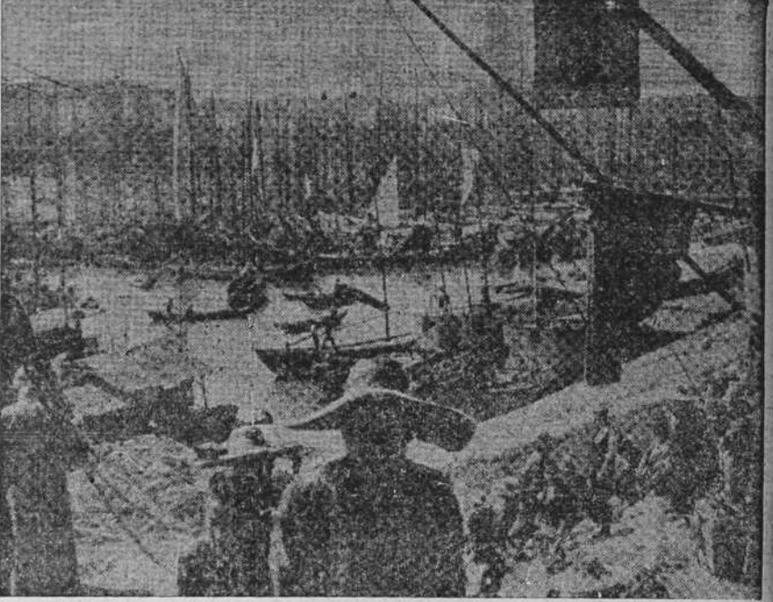
Un aspecto del puerto de Hankou sobre el río Yang-Tsé

El Duque exaltó el espíritu de sacrificio y heroísmo de los legionarios italianos que marcharon a España para defender no solamente la causa del Generalísimo Franco, sino también la de la civilización europea, en la que dieron pruebas evidentes en múltiples y victoriosos combates.—Stéfani.