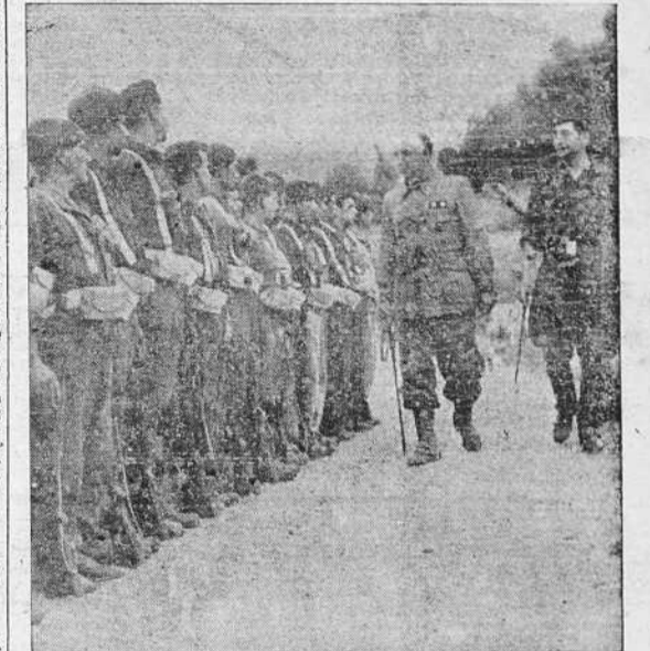
Pasando revista a las fuerzas de la Falange Española Tradicionalista, en el frente

SALAMANCA, 26.—Parte oficial de guerra del Cuartel General del Generalísimo correspondiente al día de hoy: En el frente de Madrid los rojos contraatacaron durante la pasada noche nuestras posiciones por el sector de la Cuesta de la Reina, siendo brillantemente rechazados por nuestras fuerzas que les causaron elevadísima cantidad de bajas. En los demás frentes sin novedades dignas de mención.