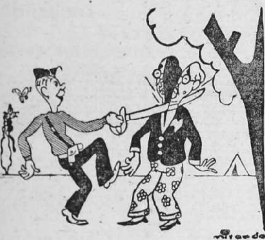
ENVIO, por Miranda. La "mediación" bien entendida

MAS: 5 céntimos por cada Domingo, para prensa a los Combatientes.