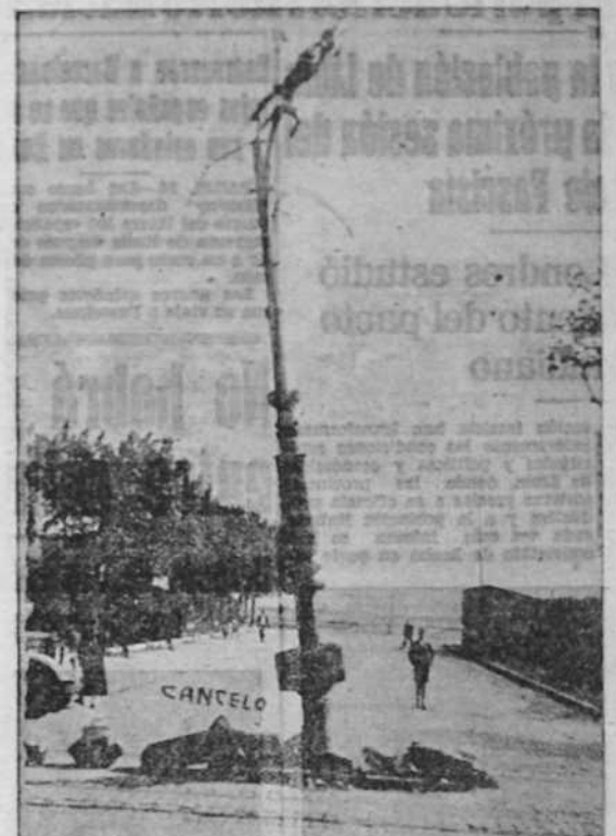
Estado en que quedó esta columna después de cables del tranvía, en la calle de Sánchez Bregua, a consecuencia del choque de un autobús.