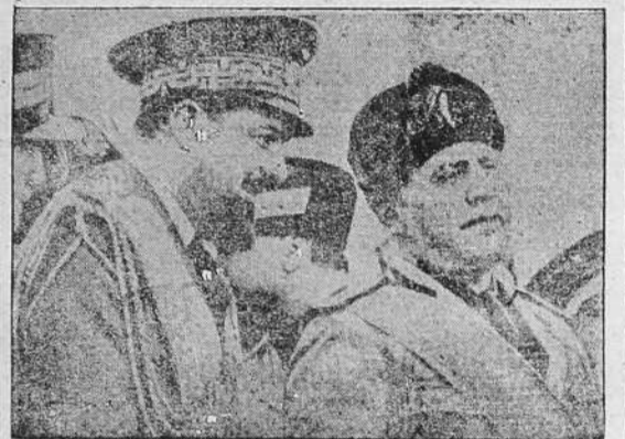
El mariscal Balbo, Gobernador general de Libia, y el Duce

acción fascista han transformado enteramente las condiciones espirituales y políticas y económicas de Libia, donde las provincias costeras gracias a su eficacia productiva y a la población italiana cada vez más intensa se han convertido de hecho en parte in-