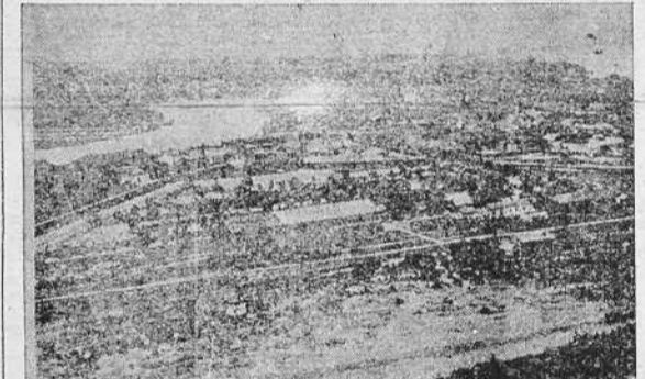
Dos vistas panorámicas de la ciudad de Hankou, que ayer terminaron de ocupar las tropas japonesas

TOKIO, 26.—Las tropas japonesas han efectuado la ocupación de Houchang. Las tropas chinas se retiraron en completo desorden a lo largo del ferrocarril Cantón-Hankou. Tanto Hankou como Houchang están destruidos por los incendios provocados por los chinos mismos antes de su retirada.—(Stéfani).