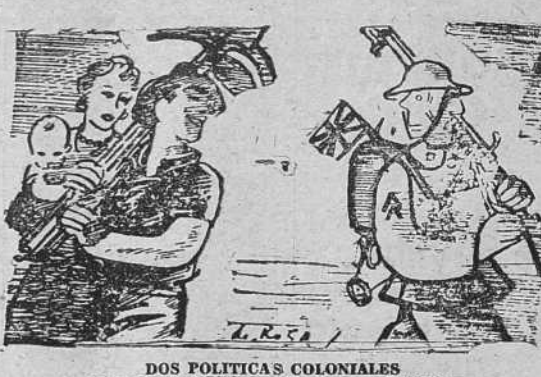
DOS POLITICAS COLONIALES Saliendo para Libia y saliendo para Palestina