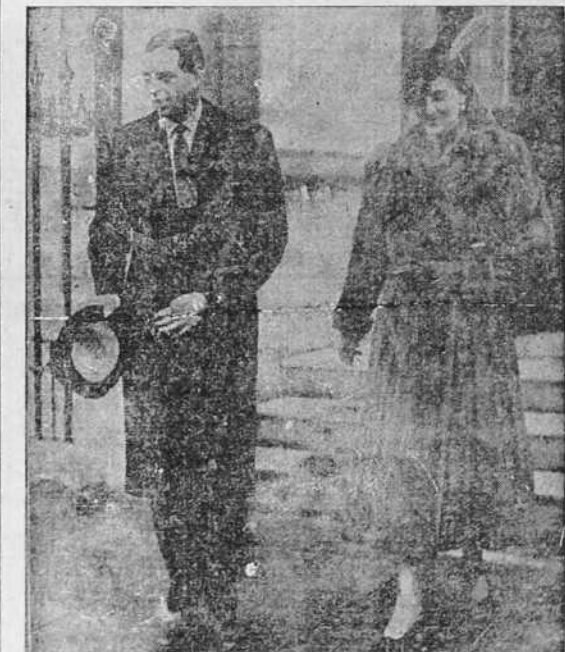
El duque de Kent, nombrado recientemente Gobernador de la Confederación de Australia. En breve partirá, acompañado por su esposa y sus hijos, el príncipe Eduardo y la princesa Alejandra, para tomar posesión de su cargo.

PARIS, 1.—El comité del partido socialista del departamento del Sena ha decidido, después de las elecciones parciales en el noveno distrito, retirar a su candidato para favorecer al comunista que cuenta con más votos. También acordó el comité pro-