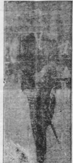
SIR NEVILLE HENDERSON Embajador británico en Berlín

A la salida del Consejo los periodistas preguntaron a éste si seguía siendo partidario de la devolución, medida que había defendido anteriormente. El ministro contestó que las cosas habían variado y que ya no creía necesaria la adopción de dicha medida. En los centros bien informados se afirma que existen hondas discrepancias entre los ministros respecto a las medidas económicas necesarias y los procedimientos para su aplicación.