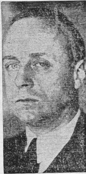
VON RIBBENTROP Ministro de Negocios Extranjeros del Reich

La Conferencia se reunirá rápidamente y se cree que en veinticuatro horas dictará su fallo