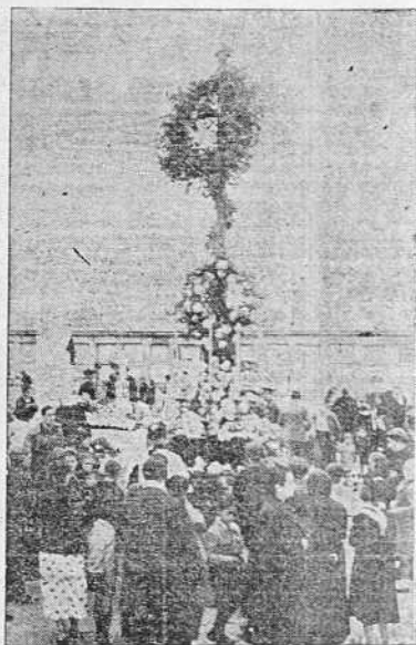
VARIOS ASPECTOS DEL CEMENTERIO DE LA CAPITAL DURANTE EL DIA DE AYER