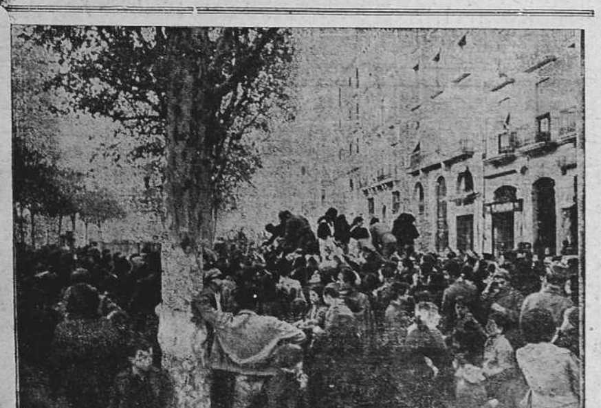
La ciudad de Tarragona ha vuelto a recobrar su normal fisonomía, luego de conquistada por las tropas del Generalísimo Franco. Lo único anormal—anormal hasta la conquista de la ciudad—es que hay pan, y las gentes se aglomeran al pie de los camiones del abastecimiento para recibir su ración.

BARCELONÉS: En el Gobierno civil se empiezan a recibir los donativos, en especie y en metálico, para las poblaciones liberadas de Cataluña.