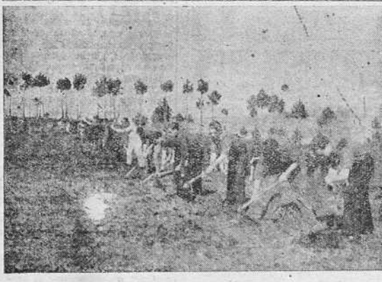
Cadetes y Flechas, fueron ayer a Pastoriza, y en uno de los montes de aquella localidad se dedicaron a los trabajos de repoblación forestal. Provisos de las herramientas necesarias destilaron en formación por la carretera, y ya en el monte, sembraron en cuatro horas una superficie de dos hectáreas.

Las fotos recogen dos momentos de la marcha por la carretera y otros dos en los trabajos de siembra. Satisfechos de la labor realizada, regresaron a las siete de la tarde a La Coruña, de donde habían salido a las ocho de la mañana.