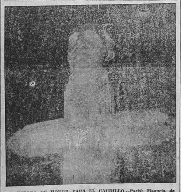
UNA ESPADA DE HONOR PARA EL CAUDILLO.—París: Maqueta de la espada monumental de honor otorgada por el escultor francés René del Sartre y que será ofrecida al Generalísimo Franco.

LONDRES, 11. - COMUNICAN DE TALLIN QUE LETONIA HA RECONOCIDO DE 'JURE' AL GOBIERNO NACIONAL ESPAÑOL.