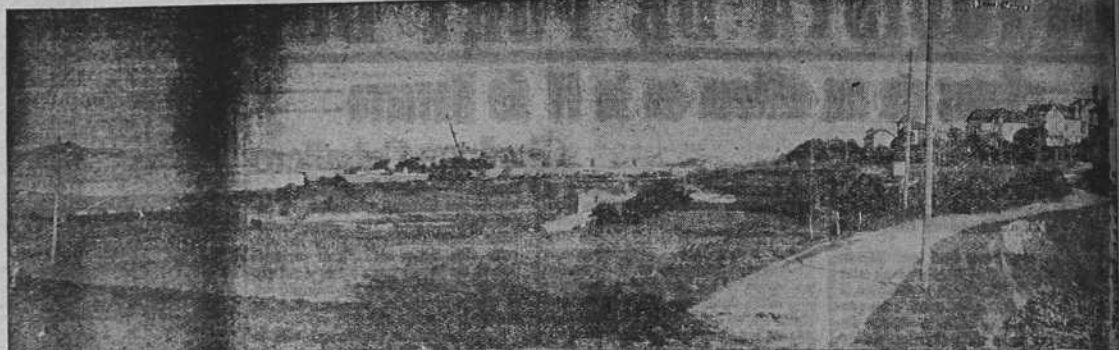
En esta perspectiva inédita de La Coruña se aprecia, en toda su extensión, la hondanada de Riazor donde va a ser construido el magnífico Estado Municipal. A la izquierda, tras el muro que se ve al fondo, está el campo del Club Deportivo y la ensenada del Orrán, y a la derecha las casas de la Avenida de la Habana, en la Ciudad Jardín. En el centro, la verde pradera donde se ha de asentar la gran Palestra coruñesa.

COMUNICAN a sus amistades que las misas que se celebren el día 13 de Marzo de 1939, de NUEVE a DIEZ y MEDIA de la mañana, en la Iglesia de SAN NICOLAS, serán aplicadas por su eterno descanso.