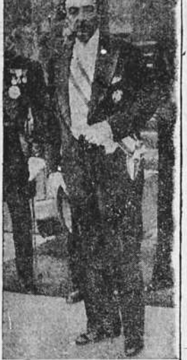
El señor Lequerica, Embajador de España en París, al salir del palacio del Eliseo después de haber presentado sus cartas credenciales.

¡VIVA EL EJERCITO! ¡VIVA FRANCOS! ¡ARRIBA ESPAÑA! ¡VIVA ESPAÑA!