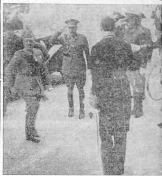
S. E. el Generalísimo llega al Palacio de Capitanía para el acto de presentación de las Cartas Credenciales por el Embajador inglés Sir Mauricio Peterson.