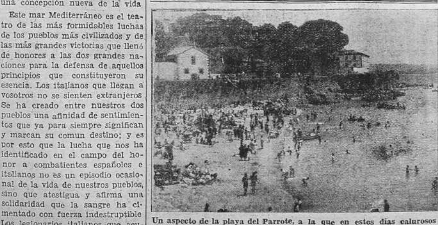
Un aspecto de la playa del Parrote, a la que en estos días calurosos concurre gran número de personas

Este mar Mediterráneo es el teatro de las más formidables luchas de los pueblos más civilizados y de las más grandes victorias que llenó de honores a las dos grandes naciones para la defensa de aquellos principios que constituyeron su esencia. Los italianos que llegan a vosotros no se sienten extranjeros. Se ha creado entre nuestros dos pueblos una afinidad de sentimientos que ya para siempre significan y marcan su común destino; y es por esto que la lucha que nos ha identificado en el campo del honor a combatientes españoles e italianos no es un episodio ocasional de la vida de nuestros pueblos, sino que atestigia y afirma una solidaridad que la sangre ha cimentado con fuerza indestructible. Los legionarios italianos que acu-