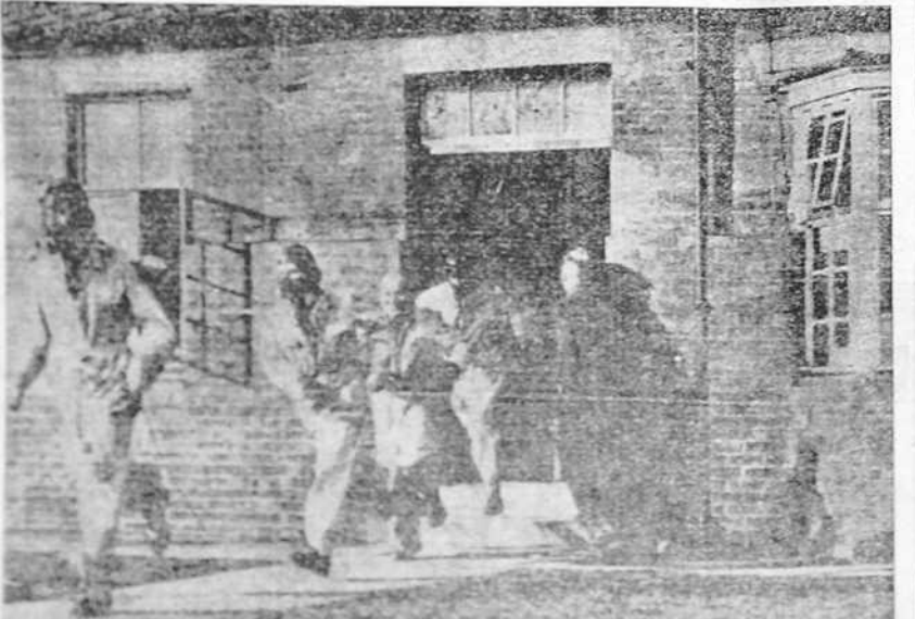
Particularmente en el aire, Gran Bretaña quiere salir de su inferioridad y se apresura a intensificar su producción y el adiestramiento de sus soldados. Estos figuran en el primer lugar de las reales fuerzas; mandan los nuevos aparatos "Hurricane", el avión que, según los técnicos, ofrecerá muchas sorpresas. Los campos de entrenamiento aéreo se hallan en Northford.

Por la tarde asistieron a una recepción dada en su honor por la organización "Amigos de España". Esta noche los periodistas se dividieron en dos grupos: unos cenaron en el palacio de San Jaime, invitados por los oficiales de guardia, y otros acudieron al Club Español.