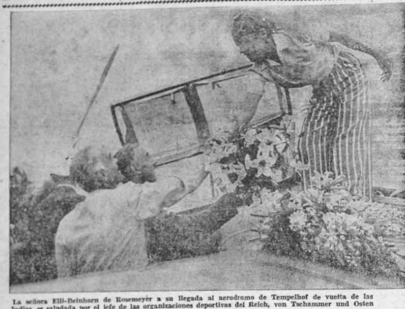
La señora Ell-Beinhorn de Rosemeyer a su llegada al aeródromo de Tempelhof de vuelta de las Indias, es saludada por el jefe de las organizaciones deportivas del Reich, von Tschammer und Osten