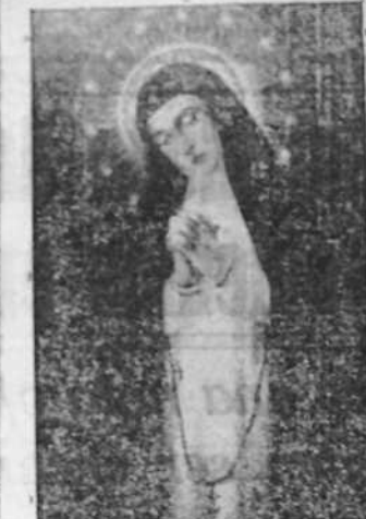
solemne triduo en la Parrquia de San Nicolás...