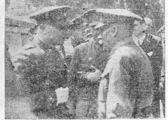
El general Cánovas Lacruz saludando a las autoridades al descender del tren. -- Conversando con los generales Martín Alonso y García Benítez