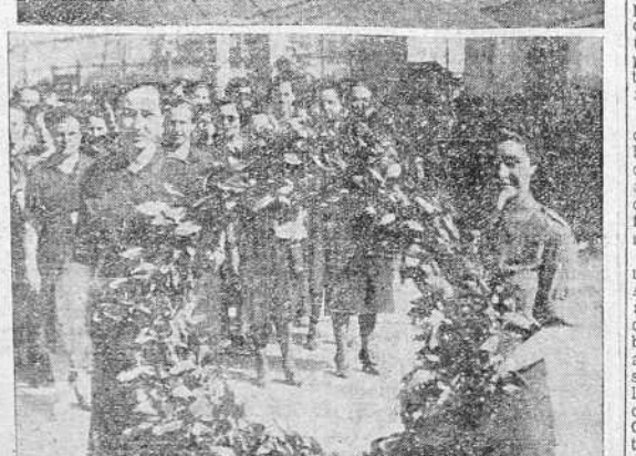
Ayer llegaron a La Coruña las jóvenes de la Sección Femenina de Falange Española Tradicionalista que, a bordo del "Ciudad de Alicante", realizan un crucero por el Atlántico. He aquí varios momentos de la llegada y estancia de las simpáticas muchachas en nuestra capital. Momento de descender del barco.— Los jefes de la Expedición, a bordo con las autoridades.— Dirigiéndose a depositar una corona bajo el nombre de José Antonio, en la fachada de la Parroquia de Santa Lucía.