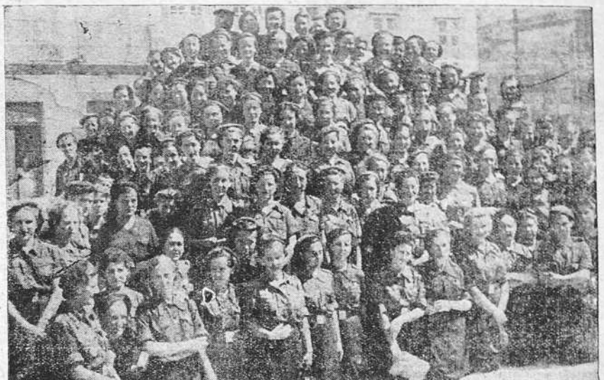
Un grupo de las jóvenes de la Sección Femenina de Falange Española Tradicionalista que ayer llegaron a La Coruña en el "Ciudad de Alicante", en cuyo barco realizan un crucero por el Atlántico.

Polonia, terminan diciendo, olvida por completo que está forzada a vivir en el mismo espacio vital de Alemania.