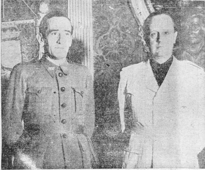
En la Secretaría General del Movimiento ha tomado posesión de su cargo el nuevo Secretario General de Falange Española Tradicionalista y de las JONS, general Muñoz Grande. El general Muñoz Grande con don Raimundo Fernández Cuesta en el acto de la toma de posesión.