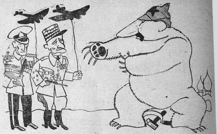
—Ante todo, yo adoro a los generales y hago un enorme consumo de ellos!

Por iniciativa del Sindicato Nacional de Obreros Ferroviarios se va a hacer a fines de semana un último intento para llegar a un acuerdo con las empresas. Si el intento fracasa, es seguro que los sindicatos adopten la resolución de ir a la huelga.