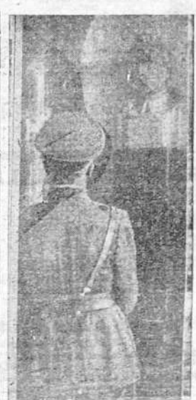
Hitler en meditación ante un busto del mariscal Pilsudsky, en Kielce

Todavía en vida del mariscal Pilsudsky mantuvimos cordiales relaciones con Polonia, pero desde su muerte comenzó una cruzada contra todo lo alemán, cruzada tan violenta, que destruyó las buenas relaciones entre los dos pueblos.