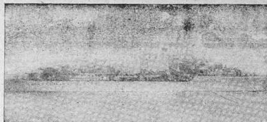
El destructor inglés "Cossack", que abordó al vapor alemán "Altmark" en el fiord noruego de Jossing

BUCARESTI 24.—El ministro Sidorovitch regresó esta mañana de su visita a Italia.