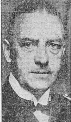
El Almirante Raeder, jefe de la flota de guerra alemana

Declara el jefe de la flota alemana que la colocación de minas en aguas del Báltico no constituye un peligro para la navegación, ya que para que surtiese efecto el minado sería necesaria una operación extraordinaria.