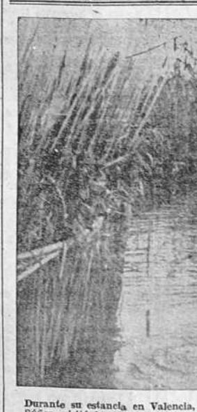
Durante su estancia en Valencia, el presidente de la Junta Política y ministro de Gobernación, señor Serrano Súñer, visitó la Albufera. El señor Serrano Súñer, pescando el "morcuil" en el lago de la Albufera.