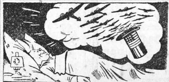
EL SUEÑO DE CHUELL (3.000 aviones al mes)

La labor a realizar es mucha. Si no fuésemos tan poco amigos de acudir al extranjero en busca de lecciones recordáramos lo que está sucediendo en Francia. Se trata de buscar a los grandes responsables de la catástrofe, y un periódico recuerda que no se debe olvidar la gran culpa de los intelectuales y educadores, más obligados que los otros a la perfección. Es cierto, sin una minoría rectora sana y, sobre todo, fanáticamente española, correremos el riesgo de que la mejor tarea política y de gobierno se pierda por falta de continuadores. El SEU lo sabe y por eso se preocupa de forjar los grupos selectos que son, en definitiva, los que dan el tono a la vida nacional.