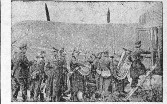
AL MARGEN DE LA GUERRA Músicos alemanes tomando el avión para horas más tarde divertir a los habitantes de Ostó

Murió el hombre más viejo de Yugoslavia Había cumplido 130 años