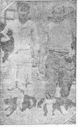
Dos aspectos trágicómicos de la guerra. Estos hombres, ataviados de tan diferentes como curiosas maneras, son marineros británicos cuyo barco fue torpedeado por un submarino alemán. Salvados en los botes, arribaron a puerto inglés y allí se les provió de las más absurdas ropas, como se comprueba en las presentes fotografías, en las que aparecen algunos "lobos de mar" vestidos uno con falda, otro con una ropa interior femenina, y otro con una camiseta raquílica.

MADRID, 14.—El próximo lunes, a las once y media, se celebrará la apertura solemne de los Tribunales, bajo la presidencia del ministro de Justicia. Se leerá la memoria del fiscal del Supremo y pronunciará un discurso el presidente de este alto Tribunal, sobre temas jurídicos.—(CIFRA).