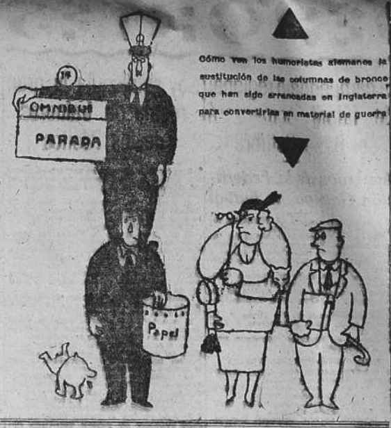
Cómo ven los humoristas alemanes la sustitución de las columnas de bronce que han sido arrancadas en Inglaterra para convertirlas en material de guerra