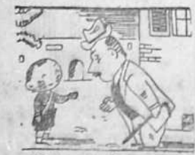
¿Cuántos años tienes, muchacho? -Cinco. -¿Y cómo es posible que en tan poco tiempo estés tan anciano?

En español Robert Taylor - Barbara Stanwick