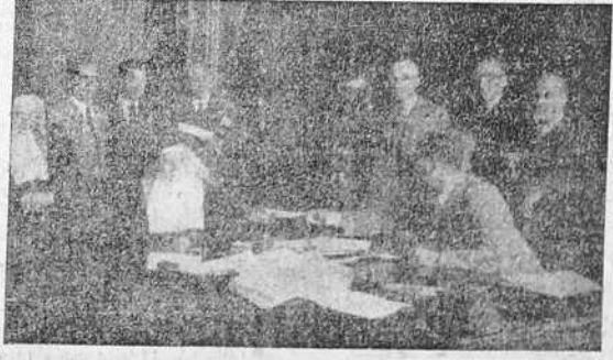
El Ayuntamiento de La Coruña ha comenzado a pagar deudas atrasadas