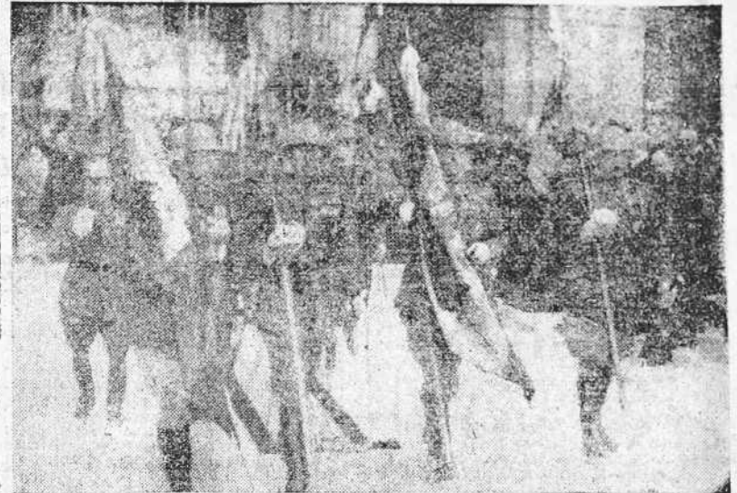
Los jefes de los diversos Regimientos de guarnición en La Coruña portando las banderas que les fueron entregadas por la Sección Femenina de Falange

Después de la instrucción y la oración, viene la limosna. Nunca olvidéis