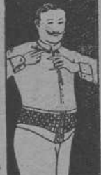
FAJA DE CABALLERO

En el precio, que oscila entre 100 y 250 pesetas, según caso y clase, va incluido todo nuestro tratamiento, que en algunos casos, puede durar hasta varios años, así como el arreglo gratuito de averías que se relacionen con el buen funcionamiento y las visitas que deseen hacernos.