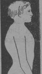
MAL DE POTT