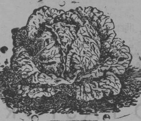
Lechuga de Repollo

Semillas de todas clases: hortalizas, forrajeras, y flores.