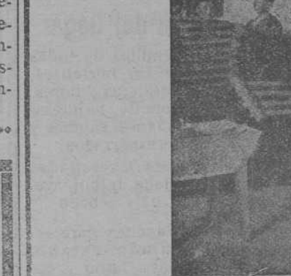
Vista de la sección de mosaico

Las especialidades de esta Fábrica, se basan en la fabricación de: Teja plana y curva, mosaicos, tuberías, etc., por disfrutar de excelentes y seleccionadas arenas, mezcla mecánica y riego por cámara pulverizadora.