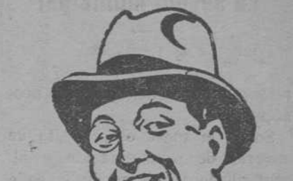
FOTO VILLAR VILLAR FOTO Frente a Correos

Cuide usted su estómago porque es la base de su salud